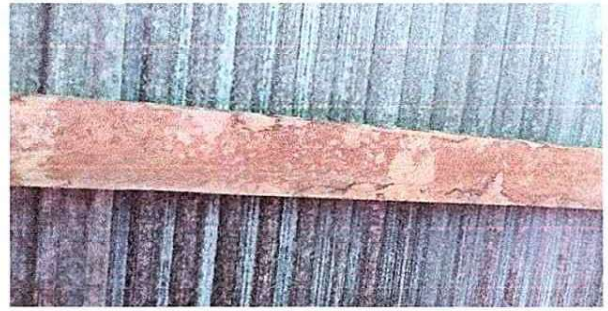
Foto 2: Se evidencia el mal estado de la viga o costanera de la estructura de lámina de la escuela.