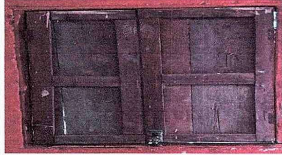
Foto 4: Se evidencia el mal estado de las ventanas del establecimiento.