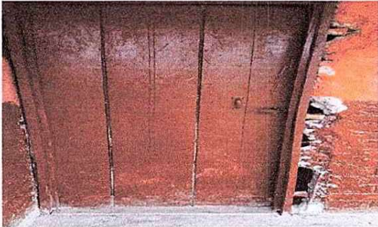
Foto 3: Se evidencia el mal estado de las puertas del establecimiento