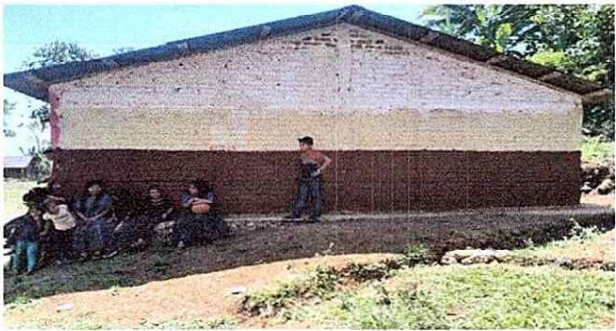
Foto 7: Se evidencia el mal estado de la pintura de la paredes de las aulas de la escuela y de la dirección