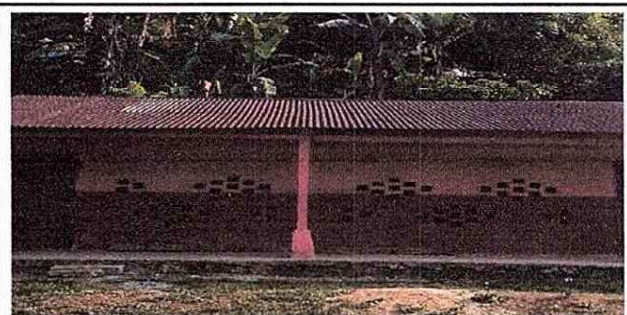
Foto 12: Se evidencia el mal estado de el techo de lámina y la falta de canales de captación de agua pluvial

Observación: Si es necesario se pueden agregar hojas adicionales y actualizar el número de hojas.