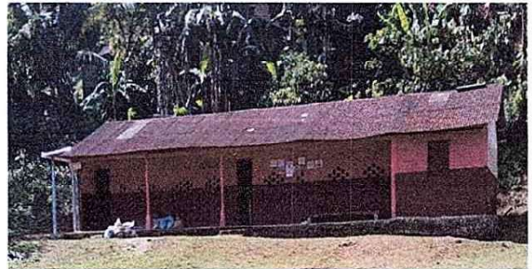
Foto 6: Se evidencia el mal estado de el techo de lámina y la falta de canales de captación de agua pluvial

Observación: Si es necesario se pueden agregar hojas adicionales y actualizar el número de hojas.