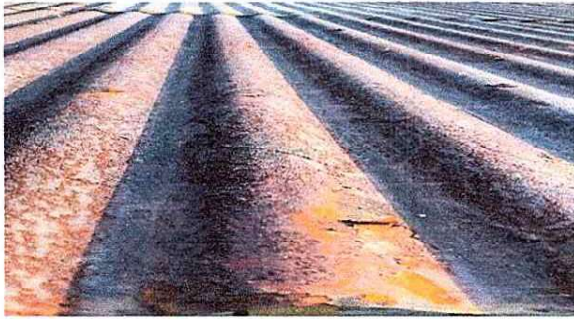
Foto1: Se evidencia el estado actual del techo de lámina del establecimiento