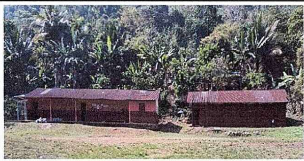
Foto 10: Se evidencia el mal estado del techo del establecimiento.